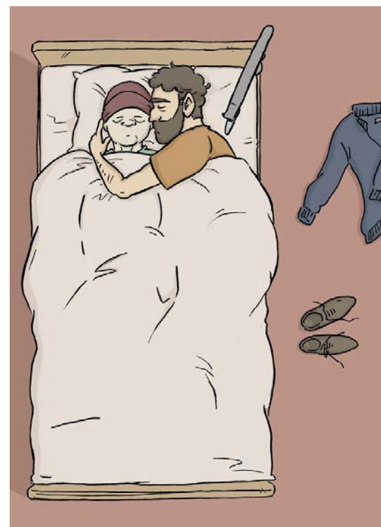
Plaat uit de graphic novel 'Naasten' (2019), p. 203 ©Melanie Kranenburg, Niek van Ooijen en Maaïke Haan.

Een graphic novel als informatiebron over mantelzorg in de laatste levensfase is best een bijzondere uiting, vindt ook maker Maaïke. 'Deze vorm is ontstaan doordat mijn projectleiders stripliefhebbers zijn. Daardoor ontstond het idee om onderzoeksresultaten eens op een heel andere manier te laten zien. Zonder mezelf op de borst te kloppen: ik vind het heel leuk om te zien dat het zo aanslaat. Misschien zou ik nog eens een boek over een ander onderwerp willen maken. Nabestaanden bijvoorbeeld, ook een soms vergeten groep. Alhoewel, het is een hoop werk. De graphic novel over naasten bestaat uit 230 pagina's. Het is niet zomaar een Donald Duckje.'